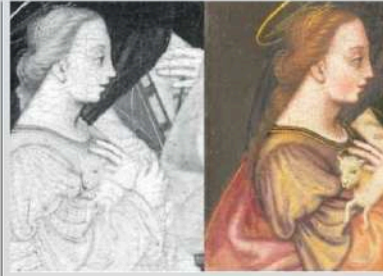
Il particolare di Sant'Agnese nel quadro di Plautilla Nelli

Plautilla Nelli (1524-1588) lavorò a Firenze, eseguendo dipinti di grandi dimensioni a soggetto devozionale, che costituiscono un'eccezione nel loro genere all'interno della storia dell'arte. Espone del Rinascimento e tra le prime donne artiste ad essere riconosciute come e tale, entrò in convento nel 1538 all'età di 14 anni, diventando suora domenicana della struttura non più esi-